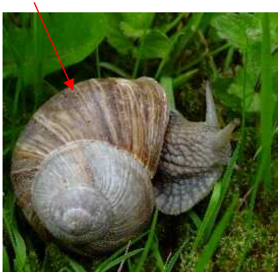
Escargot de Bourgogne

http://domenicus.malleotus.free.fr/a/escargot_de_bourgogne.htm